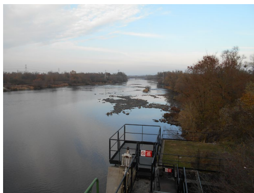
La Moselle non naviguée à Argancy en novembre 2018

La carte synthétique ci-après montre les résultats du suivi hebdomadaire pour une année – ici en exemple l'année 2015 – avec un diagramme circulaire pour chaque station de mesure des débits dans le bassin Moselle-Sarre pour pouvoir distinguer la situation d'étiage grâce à la couleur prédominante.