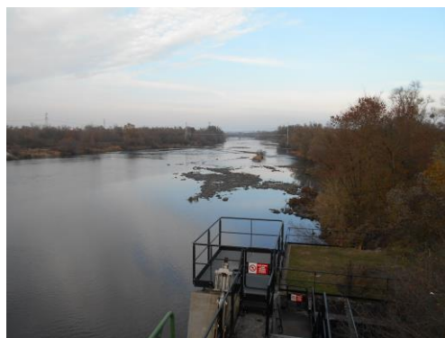
Die nicht befahrene Mosel in Argancy im November 2018

Die folgende Übersichtskarte zeigt beispielsweise die wöchentlichen Monitoring-ergebnisse für ein ausgewähltes Jahr – hier: 2015 – für jede Abflussmessstelle in Form von Kreisdiagrammen, sodass sich die Niedrigwassersituation im Mosel-Saar-Einzugsgebiet gleich anhand der vorherrschenden Farbe erkennen lässt.