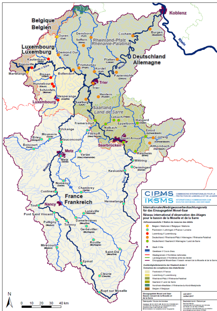
Karte 1: Niedrigwassermessstellen der IKSMS

Alle Daten der 59 Abflussmessstellen für die Kalenderwochen 18 bis 44 von 2015 bis 2017 werden der Öffentlichkeit in Kürze auf www.iksms-cipms.org zur Verfügung, und zwar in Form von Graphiken, Kreisdiagrammen, Tabellen und teilweise interaktiven Karten.